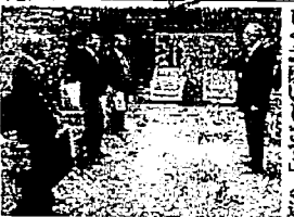
市長の元で、議員の質問をする大阪市役所

市長は三日、内部省庁と特権者の保護を定めた公益通報制度の柱となるコンプライアンス(法令順守)委員会が発足した。市長は三日、内部省庁と特権者の保護を定めた公益通報制度の柱となるコンプライアンス(法令順守)委員会が発足した。